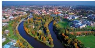
Hradecký kraj Městská hučební síň, Zieglerova 91 500 03 Hradecký kraj, Czech Republic

Orlické hory nabízejí tichý svět nedotčené přírody a jsou oblíbenou destinací pro rodinnou dovolenou. Oceníte zde klid, krásnou přírodu i domácí atmosféru. Fenoménem Podorlicka jsou zámky na řece Orlici přehodně a nazvané jako „Česká Loira“, neboť stejně jako na francouzské řece zde Divoká Orlice spojuje hned několik historických sídel.