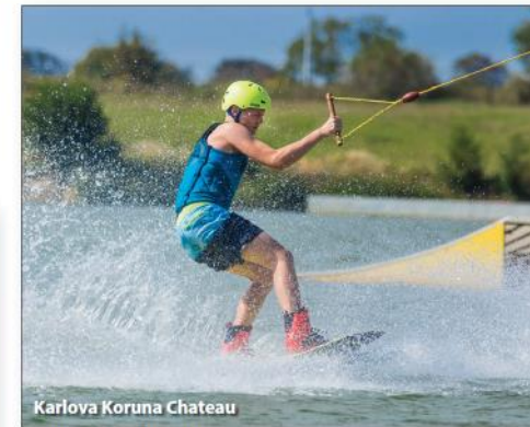
Karlova Koruna Chateau

Hradec Králové Region is situated in the North-East part of Bohemia bordering with Poland and is easily accessible from Prague by means of D11 motorway. There is also a good connection by public buses or train transport lines. The administrative centre of the region is the city of Hradec Králové also referred to as the Salon of the Republic or the open-air textbook of architecture. The region boasts breathtaking natural sights, as well as charming historical monu-