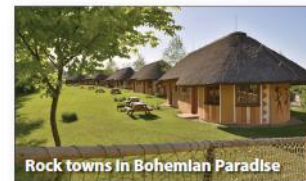
Rock towns in Bohemian Paradise