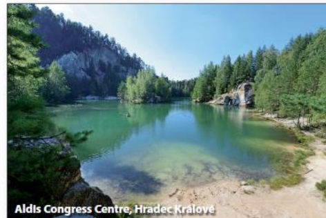
Aldis Congress Centre, Hradec Králové