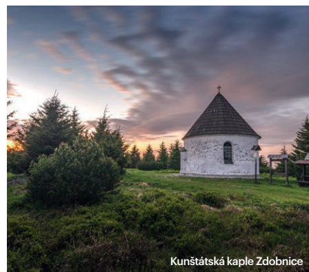
Kunštátská kaple Zdobnice