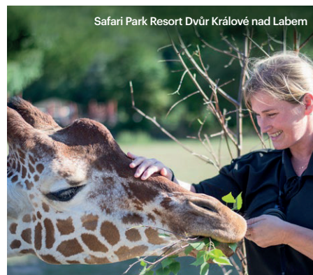
Safari Park Resort Dvůr Králové nad Labem