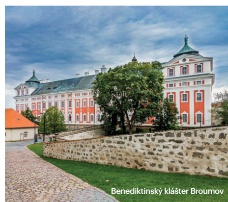
Benediktinský klášter Broumov