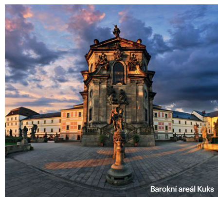
Barokní areál Kuks